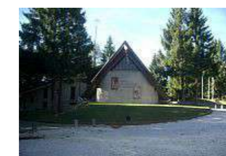
Tempio del Donatore