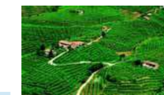
Strada del Prosecco