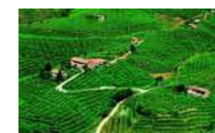
Strada del Prosecco