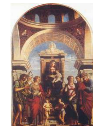
Pala del Cima