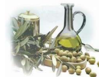
Olio Extravergine dei Colli Trevigiani